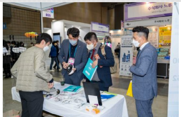
G-FAIR KOREA 2022(대한민국우수상품전시회)