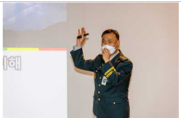
[육군사관학교] 역사의식 민족혼 교육