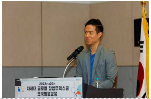
[전후석 감독] 디아스포라가 미래다