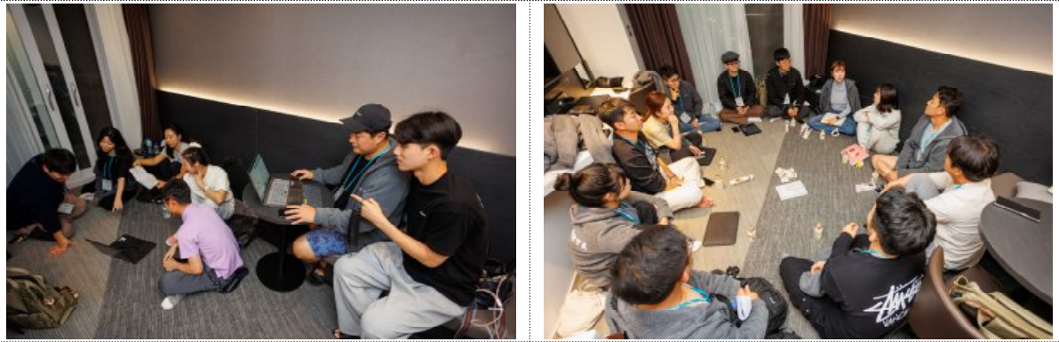
팀별 자율 분임토의