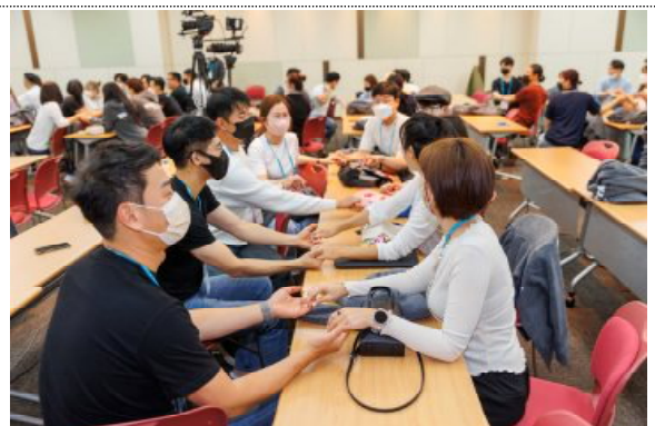
참가자 아이스 브레이킹