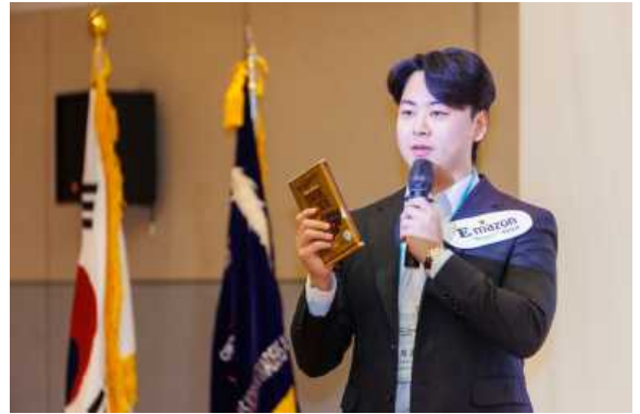
팀별 프로젝트 발표