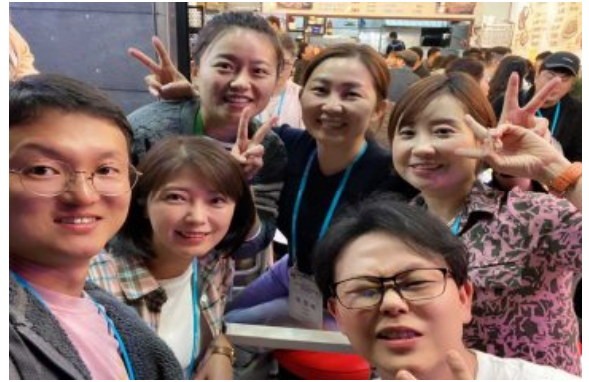
차세대 화합의 밤